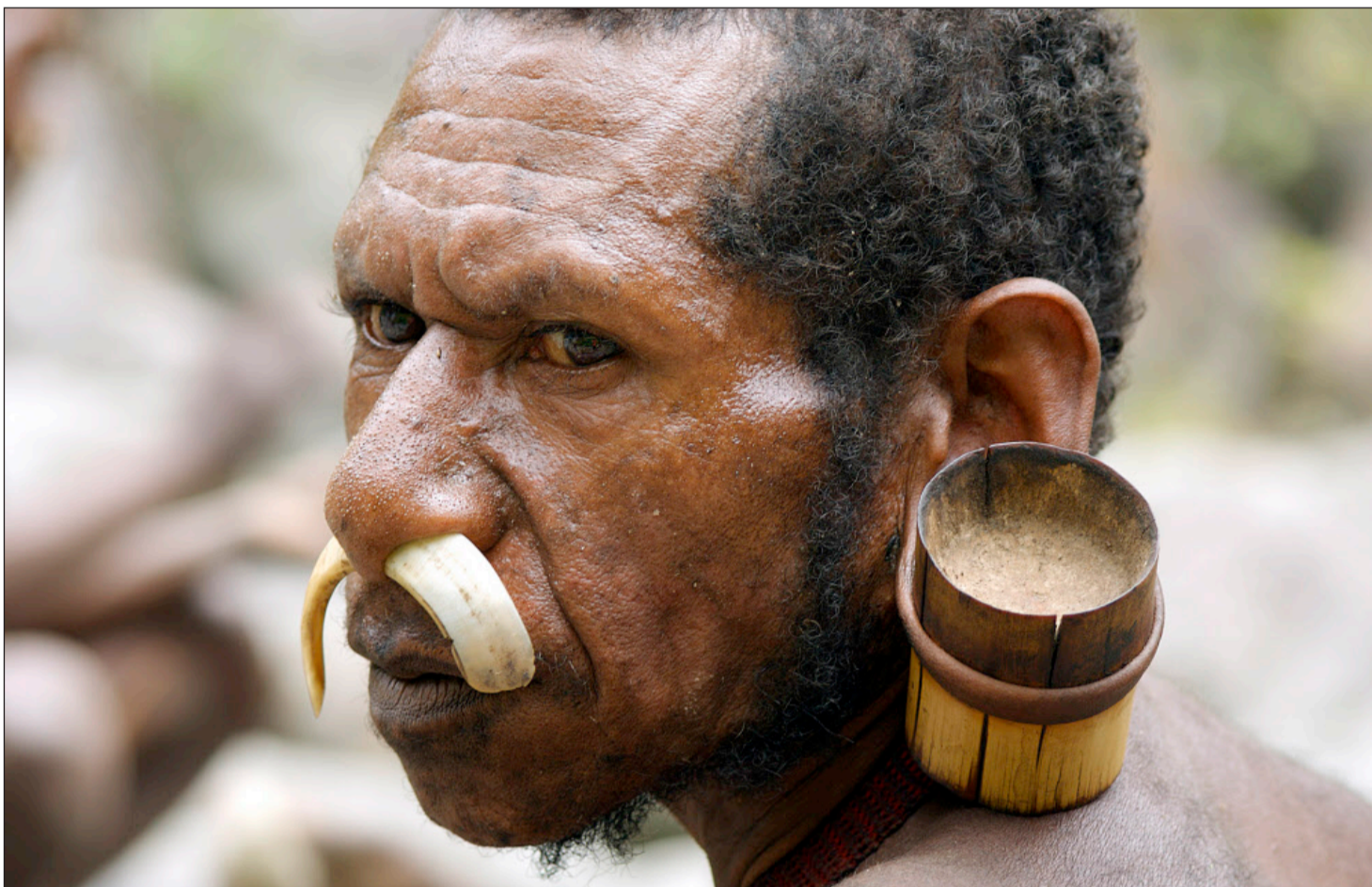
Die Ureinwohner im Regenwald von West-Papua, hier ein Una-Mann, empfangen die Westschweizer freundlich.

Die Neuenburgerin übertreibt nicht. Als Teil des fünfköpfigen Teams Exploration, das einen sechsteiligen Dokumentarfilm drehte (Ausstrahlung im April im Westschweizer Fernsehen), unternahm sie eine Indonesien-Expedition, auf die man sich mit Zeltferien am Murtensee nicht vorbereiten kann. Die Gruppe liess sich von einem Piloten eines Kleinflugzeugs in einer Lichtung mitten im Dschungel absetzen. Nach einer sechsstündigen Wanderung kam das Team samt Führer beim auf 2500 Meter über Meer lebenden Stamm der Una an. Die Begrüssung war herzlich, die Verständigung schwierig. Zwar hatten die Westschweizer etwas Indonesisch gelernt, doch nur ein einziges Mitglied der Una ist der Landessprache mächtig. Also kommunizierte man vorwiegend mit Zeichen und Gesten. Kontakt zur Aussenwelt hatten die Romands nur einmal wöchentlich. Jeweils am